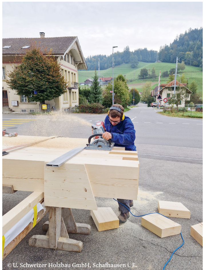
© U. Schweizer Holzbau GmbH, Schafhausen i. E.