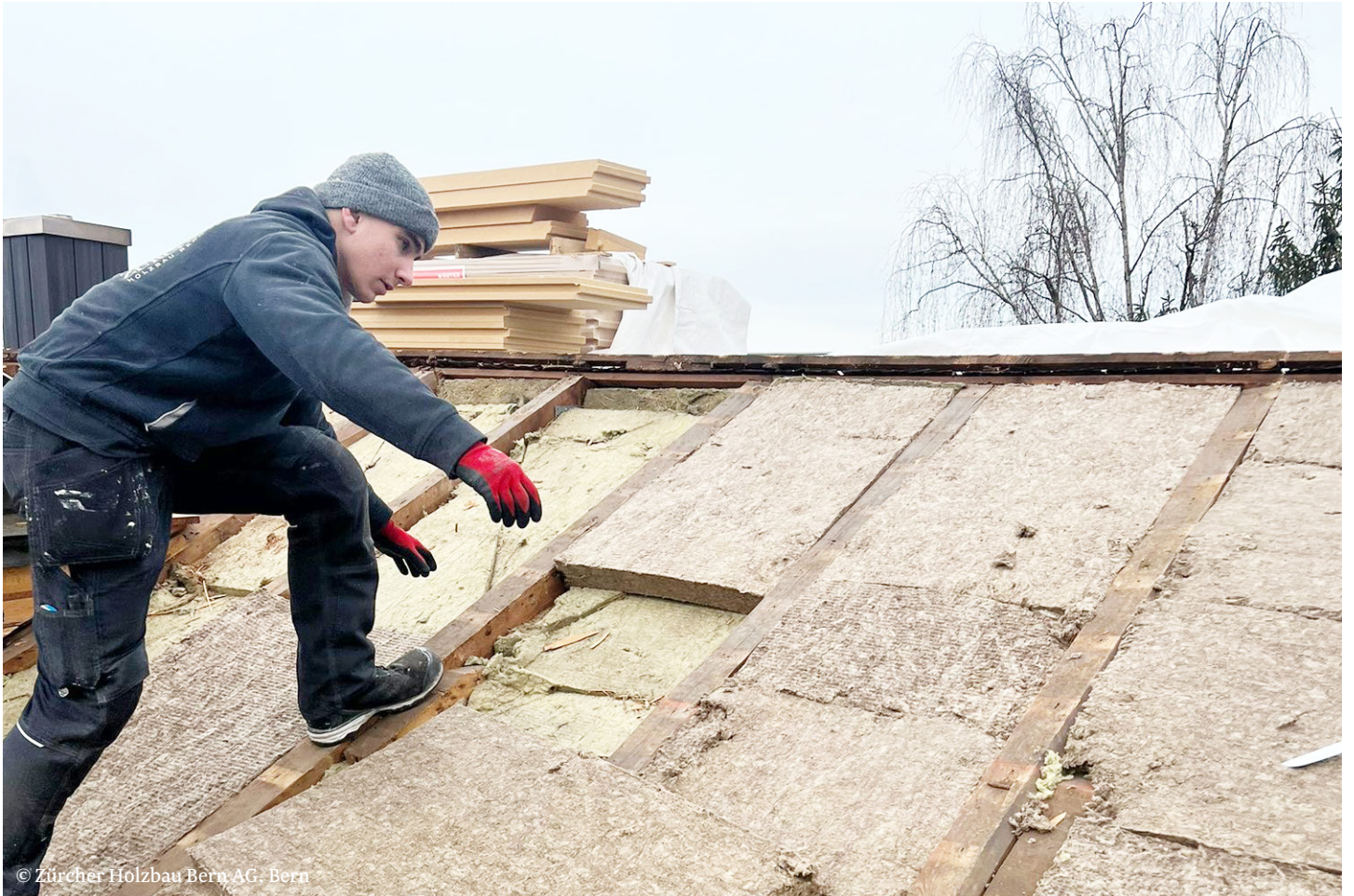
© Zürcher Holzbau Bern AG, Bern